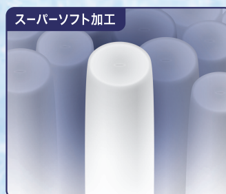
繊維の1本1本がふっくらとリラックス

日清紡「スーパーソフト」は独自のテクノロジーにより、綿などのすべてのセルロース繊維を、繊維の1本1本から改質することで他の技術では真似の出来ない、ソフトで美しい風合いを持つリラックスしたコットンに仕上げます。